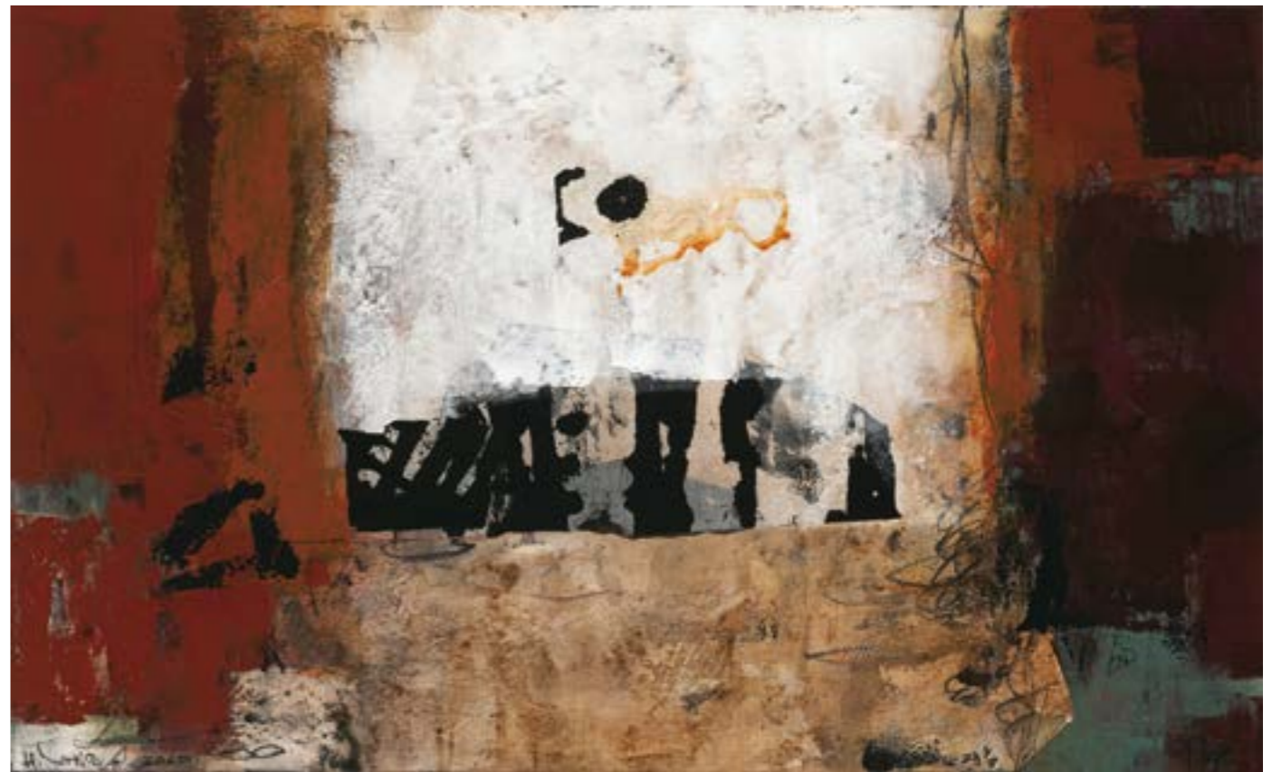
時光印-5 80F 複合媒材 2020