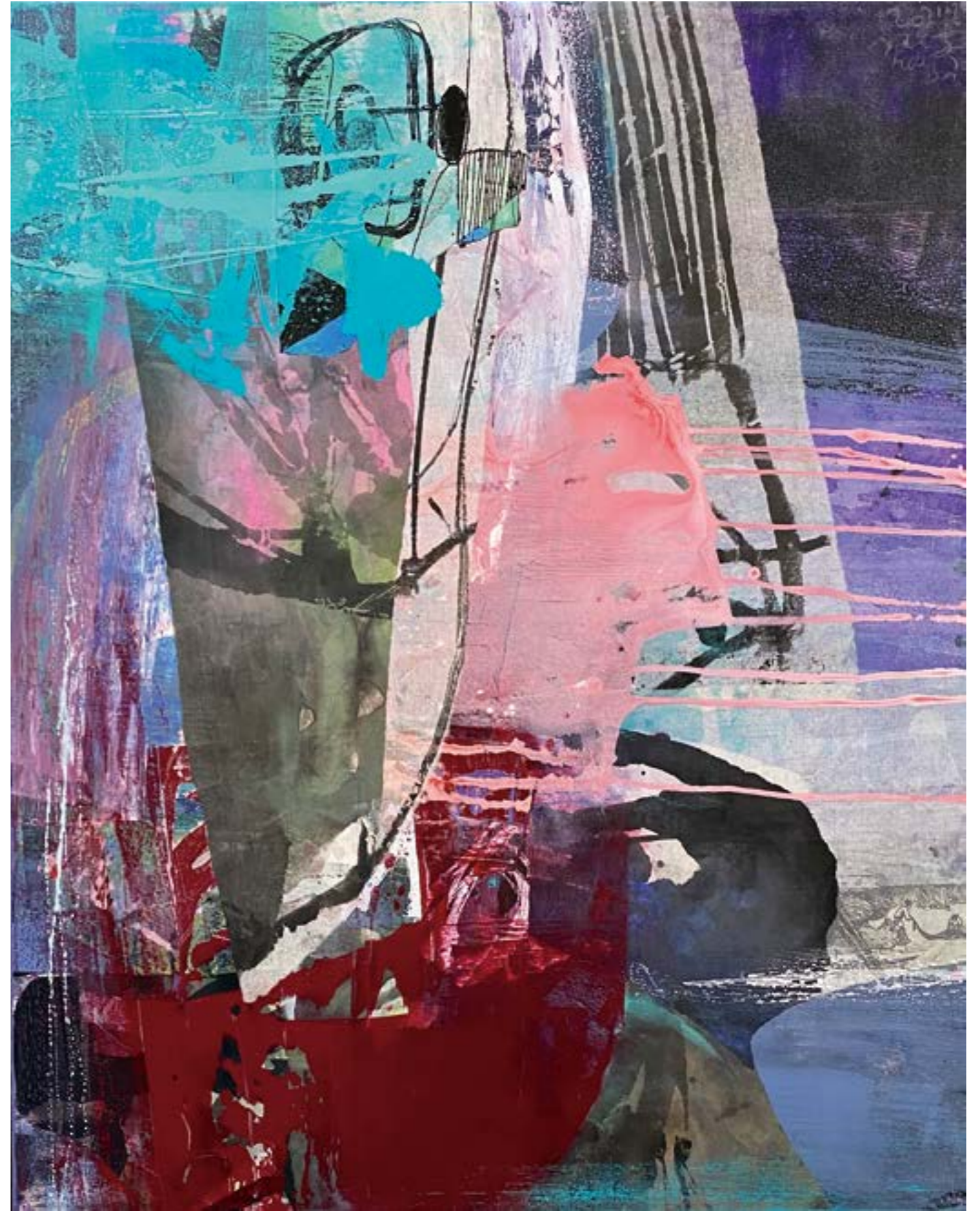
溪山漁隱 91×72cm 複合媒材、畫布 2021-2022

近期的作品則是五十歲之後對藝術創作的曠達與自信，也是試圖把多 年來深受西方藝術教育薰陶之後，回歸到東方美學思想的探討，將東方文 學、哲學和美學熔鑄在一起，透過不斷的濤洗，讓作品的「氣勢」和「氣 韻」可以顯現更大的「氣魄」，那就是「大處著眼、小處放鬆、不拘小節、 氣韻生動」！