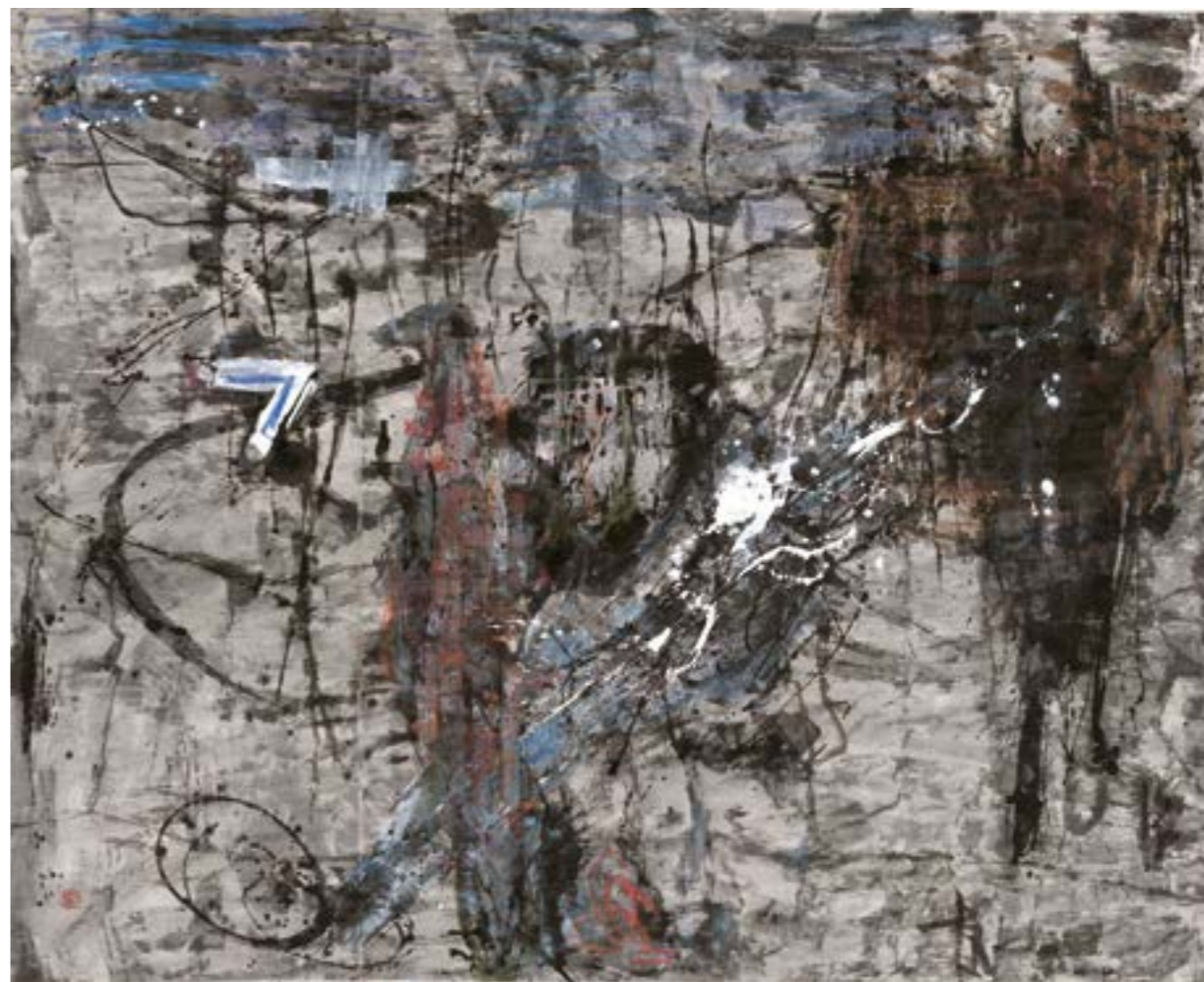
澎湖衍繹 144x179cm 水墨 蠟筆 壓克力 紙本 2022

2004 山東博物館聯展 2005 湖南博物館聯展 2006 杭州西湖美術館聯展 2007 <衝擊與與再現> 國父紀念館聯展 2009 <台北-杭州名家書法交流展> 國父紀念館聯展 2009 <漢園雅集> 國軍文藝中心四人展 2010 <寫什麼[東][西]-東方 美學與西方抽象撞擊的[書] [非書]>國父紀念館聯展 2012 <傳承與拓展> 台中港區藝術中心聯展 2012 <經典道上現風華> 西安碑林博物館聯展 2012 <傳承與拓展> 台東生活美學館聯展 2012 <墨花陶影> 士林公民會館四人展 2014 <東][西]沒有[0][X] 國父紀念館聯展 2016 <墨語心象> 黃碧惠中正紀念堂個展 2016 <[東][西]呈現-書法的 傳統與創新>中正紀念堂聯展 2018 <經典道上-傳統與創新> 中正紀念堂聯展 2019 <經典道上-傳統與創新> 加拿大多倫多中華文化中心聯展 2021 <轉變-書與非書的現代詮釋> 中正紀念堂聯展 2022 <臨界-黃碧惠當代水墨創作 展>中正紀念堂個展 出版： 2016 <墨語心象>黃碧惠水墨作品 專輯 2022 <臨界-黃碧惠當代水墨創作展 水墨作品專輯