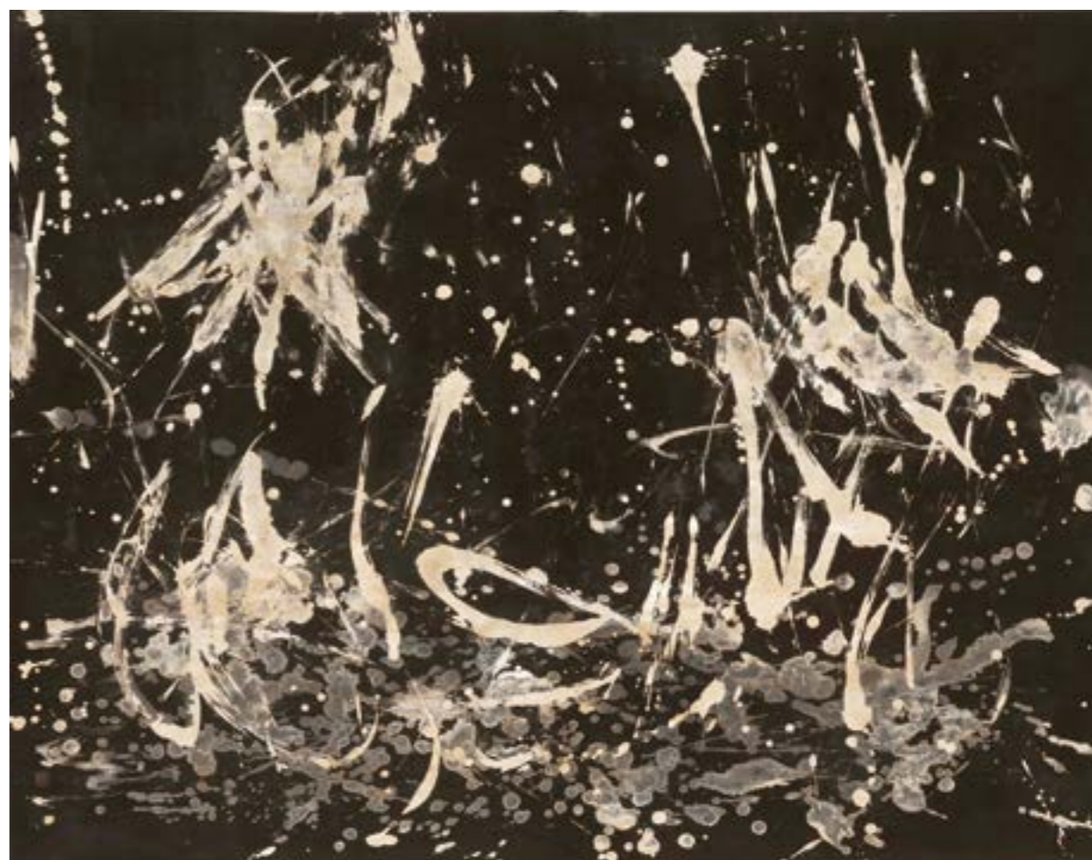
水光晚色 144x186cm 水墨紙本 2022