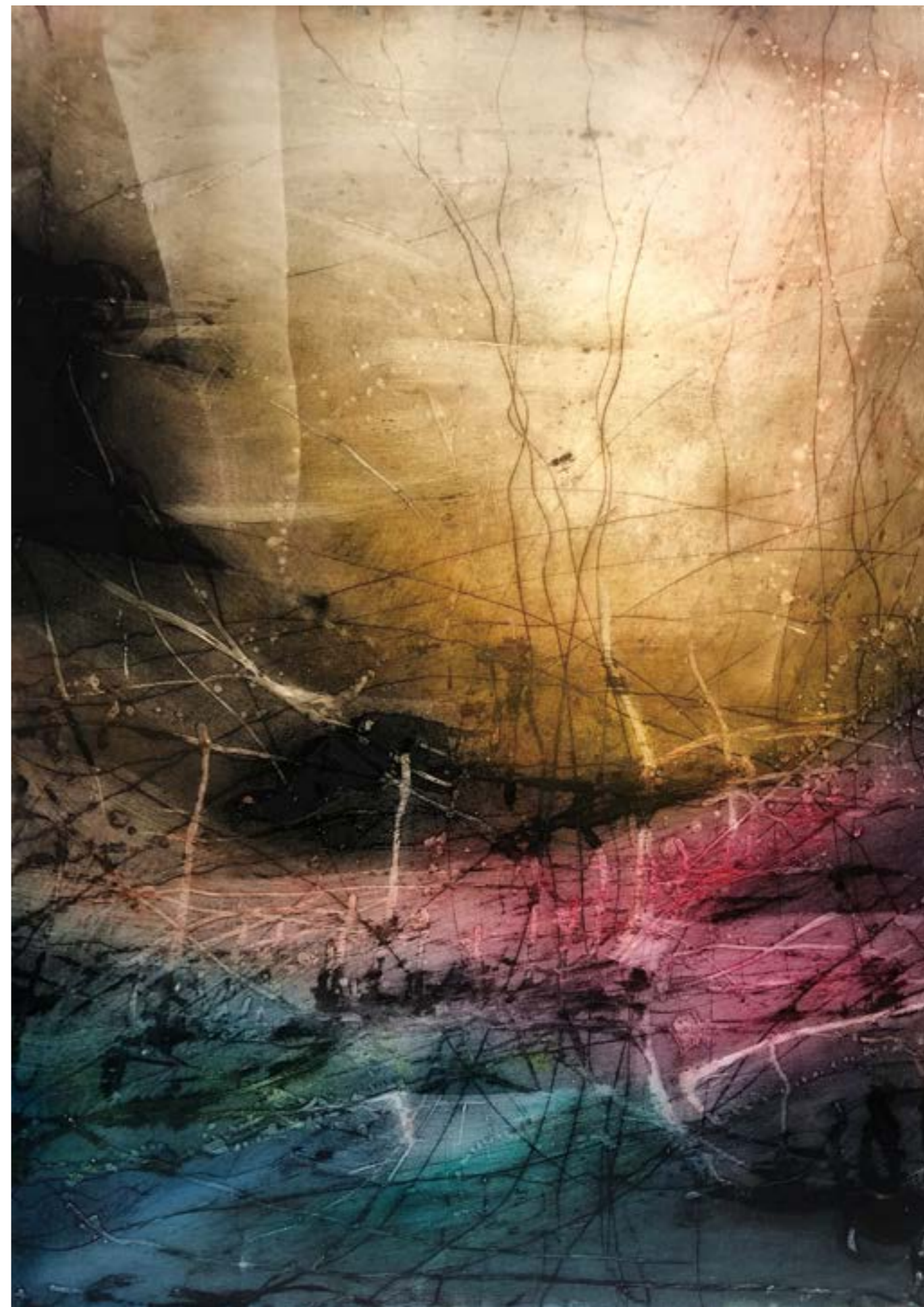
即興 #6 Improvisation VI 107.7cm x 77.4cm 複合媒材 2023

作品是抽象的表現，充滿赤裸而真誠的情感呈現。藉著作品，傳承永恆、紀錄、傳頌生命的故事。