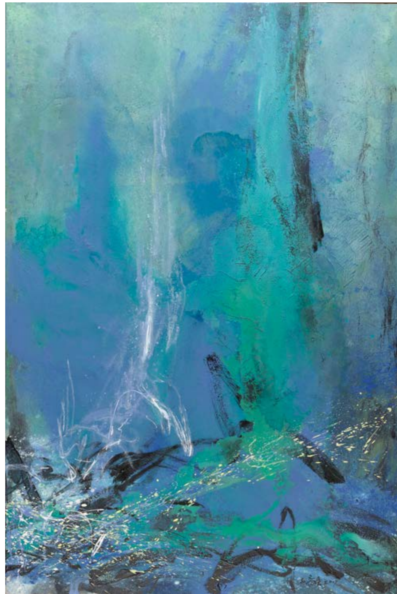
春韻 120F (130x194cm) 複合媒材 2018