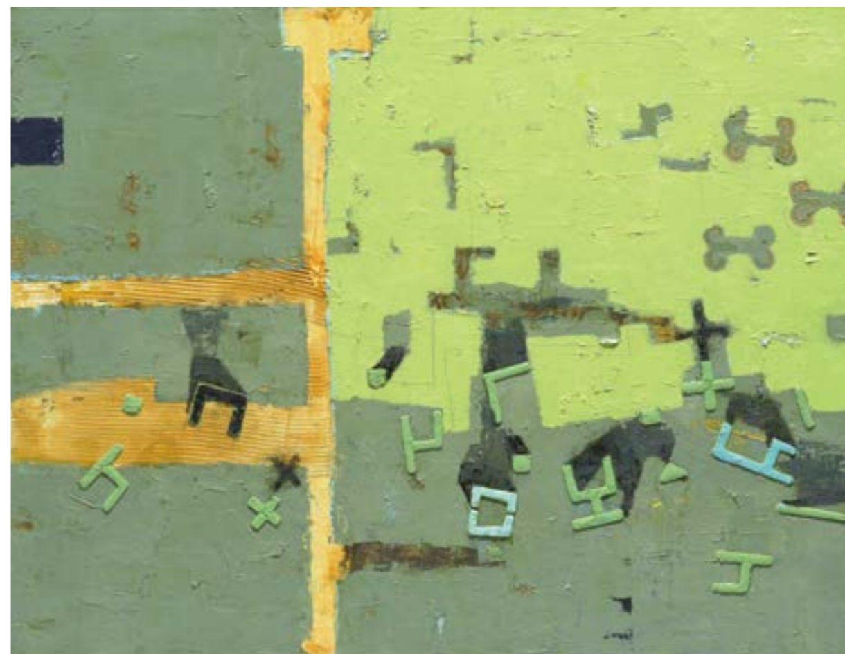
記憶·星辰 112 x 145.5 cm 複合媒材·畫布 2012-2015