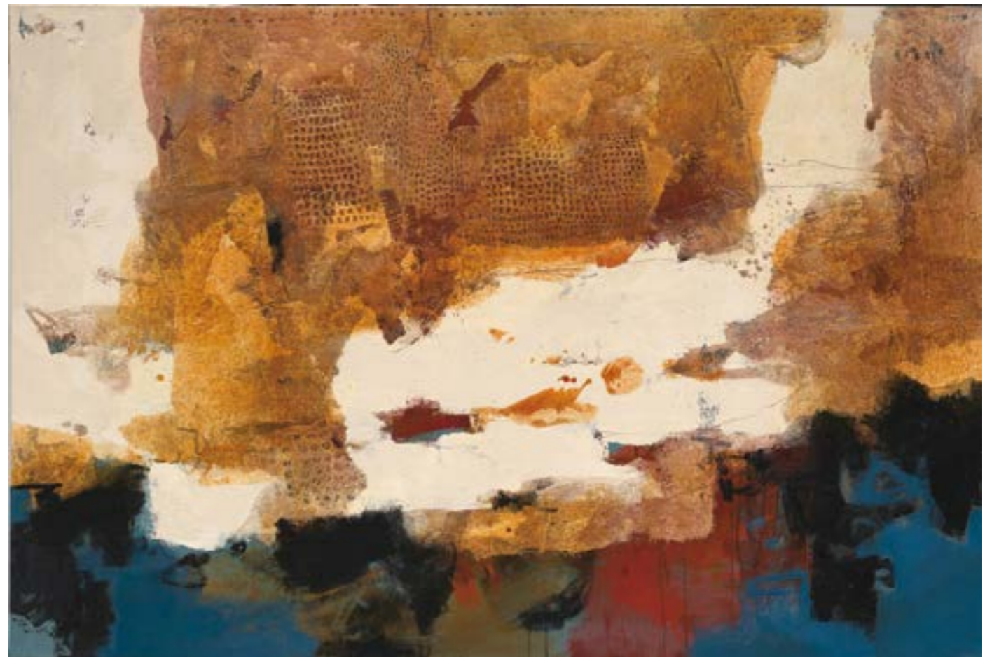
無盡藏-17 120F 複合媒材 2020