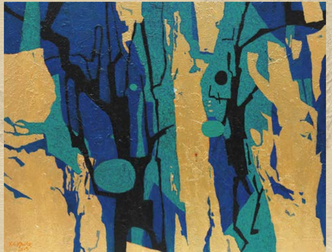
欣欣向榮 50F 複合媒材 2015