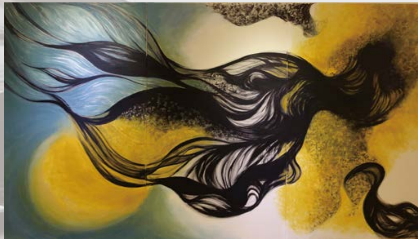
繫生 194x336cm 壓克力、畫布 2007