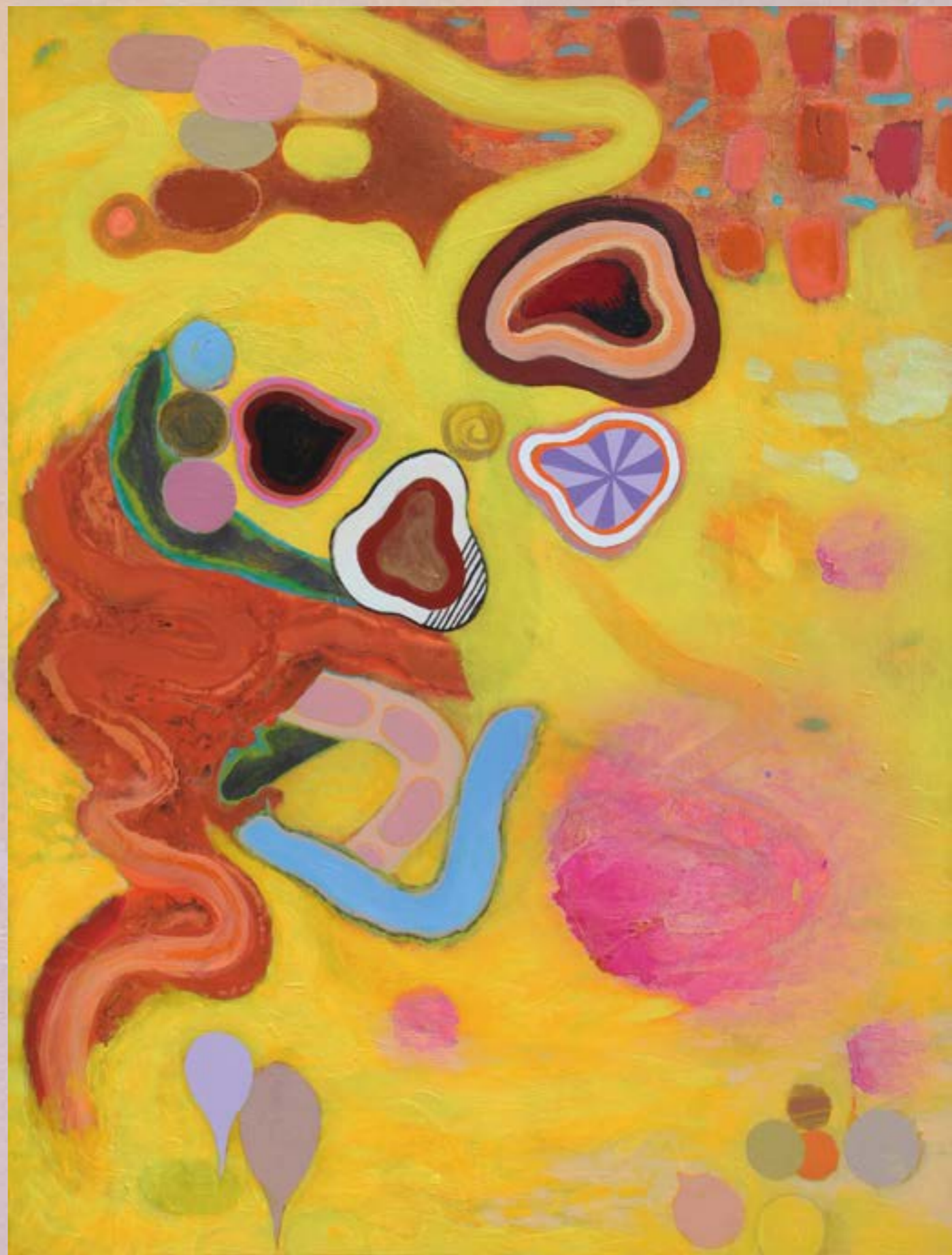
記憶的深度-1401 145.5x112cm 油畫、壓克力 2014