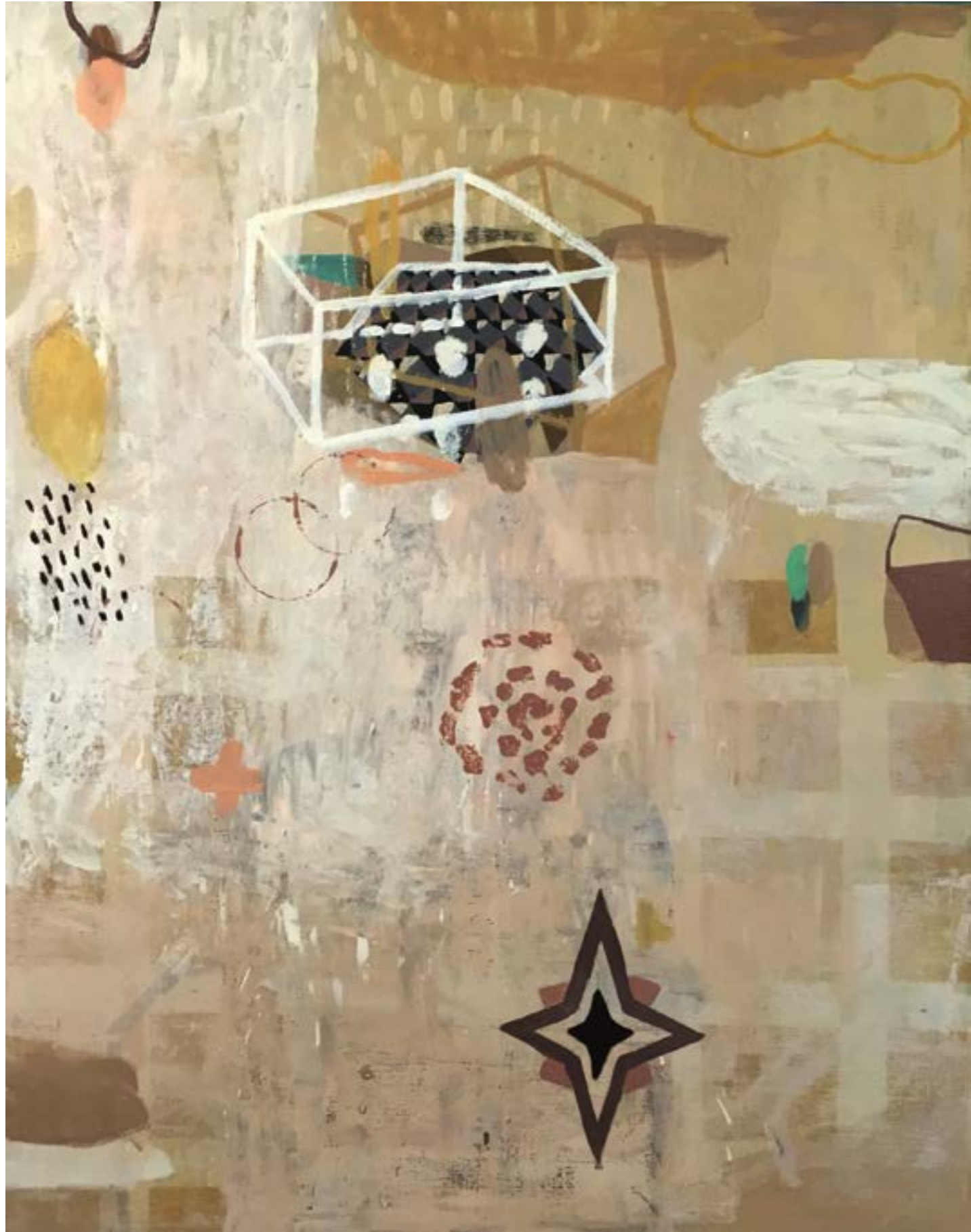
島語 116x91cm 油畫 2015