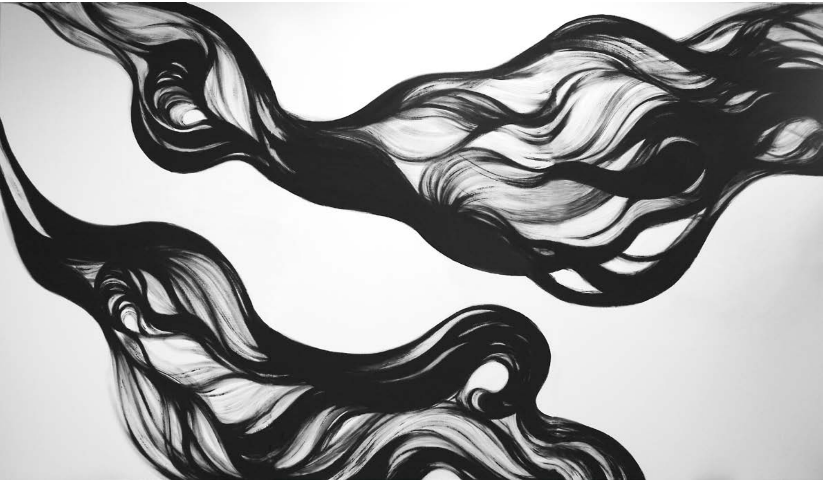
寡生 194x336cm 壓克力、畫布 2007