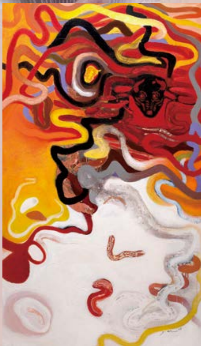
形隨意從-1006 194x130cm 油畫、壓克力 2010