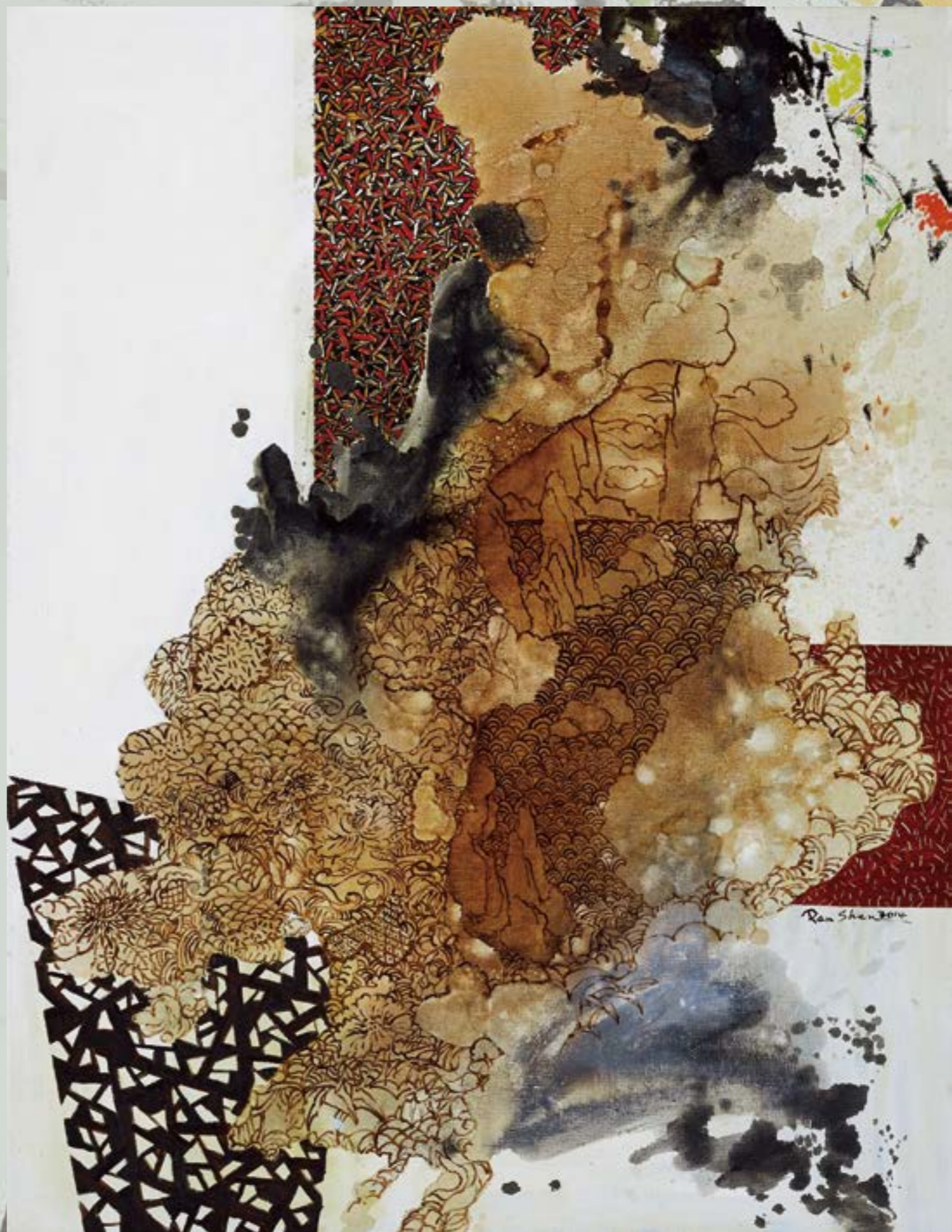
東意·西形2014 80F-01 80F 油畫 2014