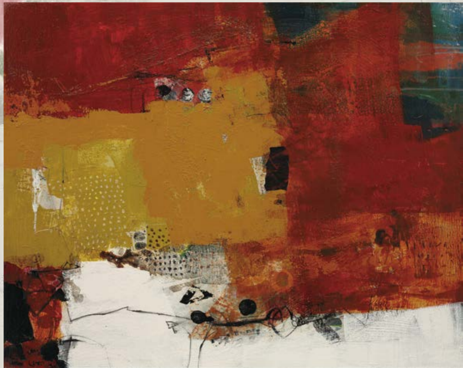
漂泊-1 30F 複合媒材 2013