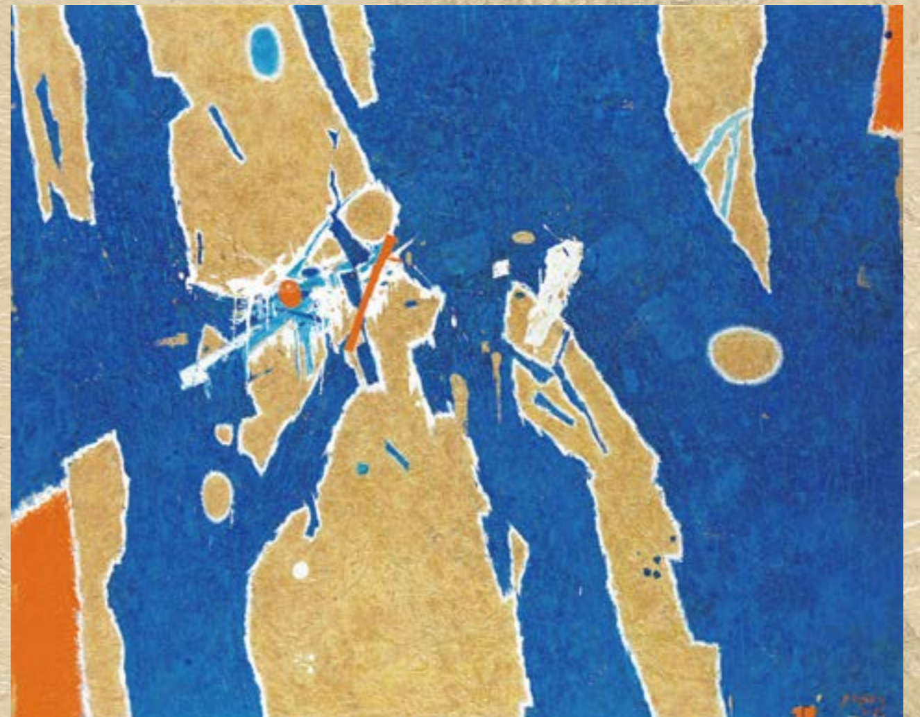
生意盈盈 100F 複合媒材 2015