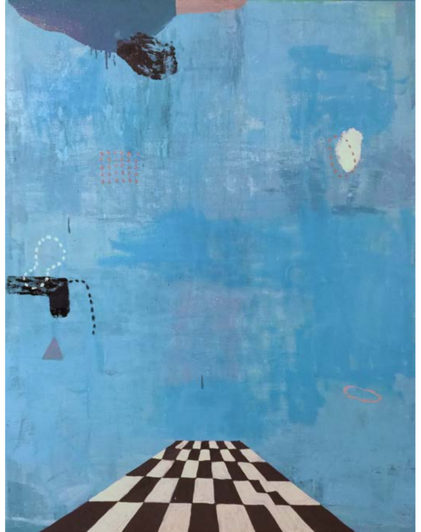
島嶼 116x91cm 油畫 2015