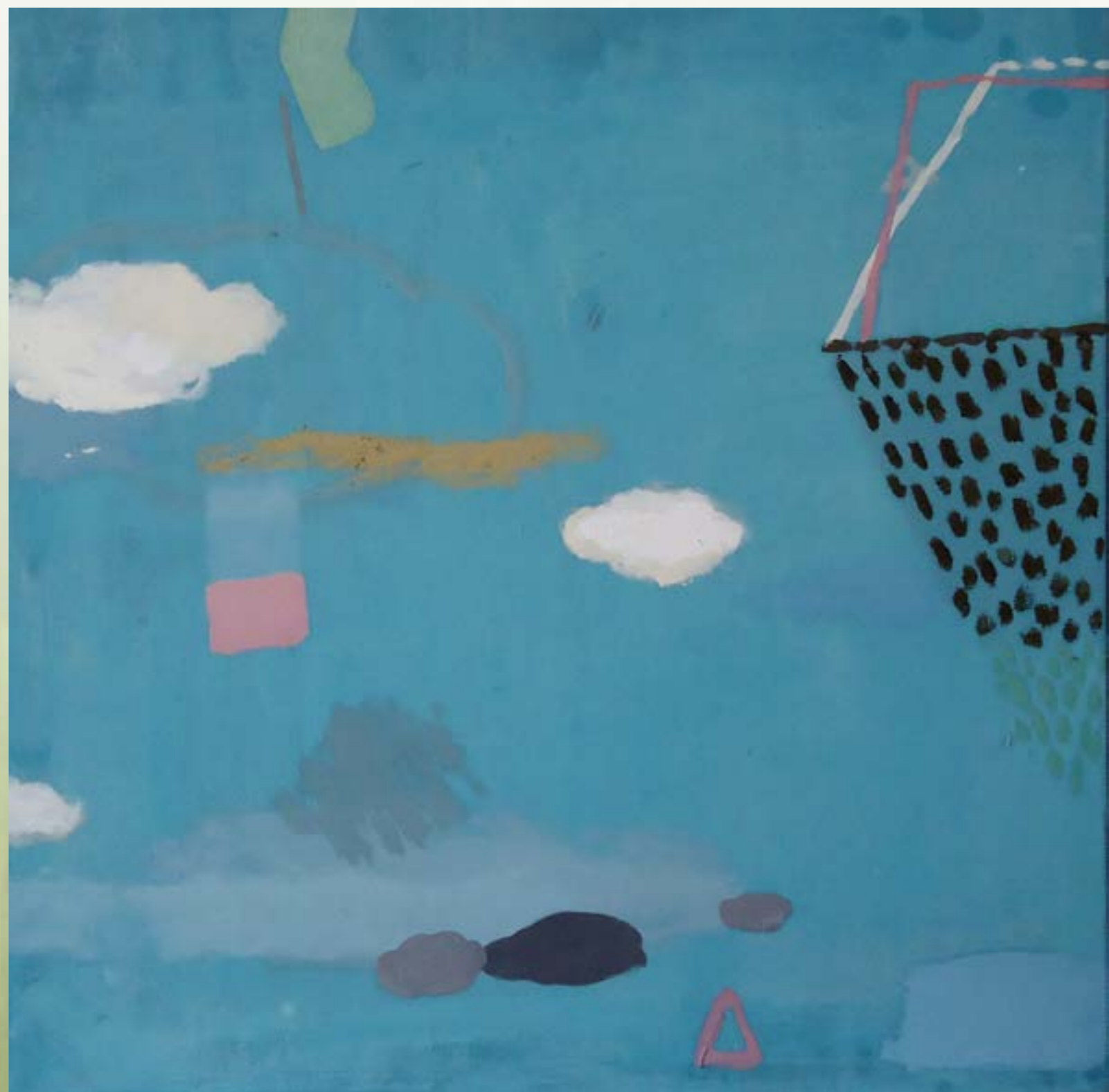
初夏之和風 60x60cm 油畫 2011