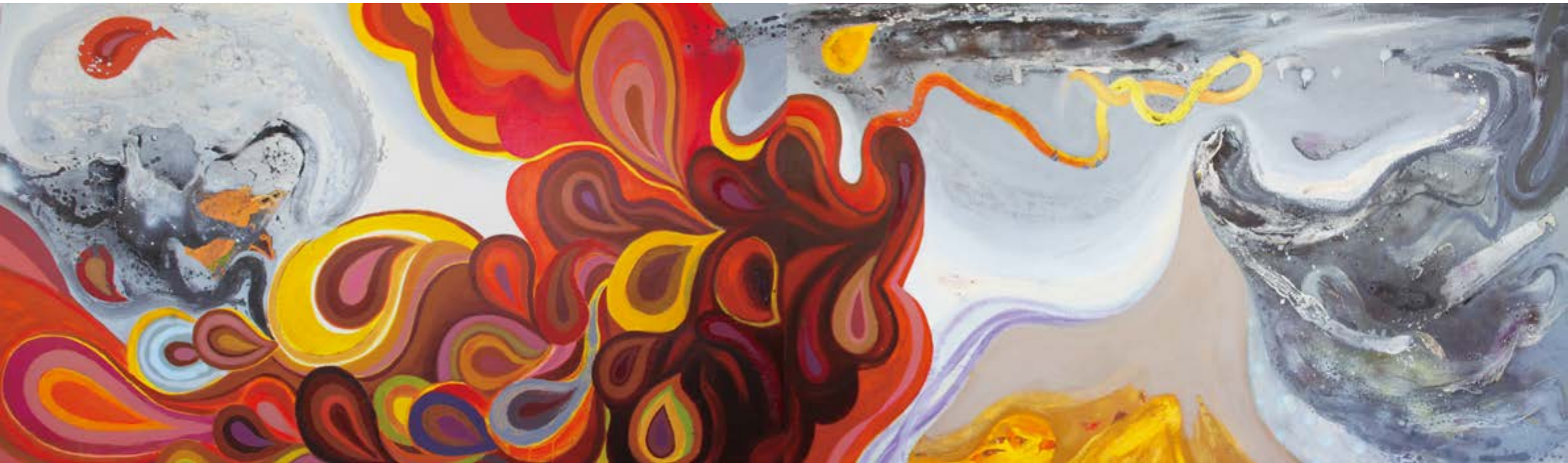
原形-1206 194x130cm(x2) 油畫、壓克力 2012