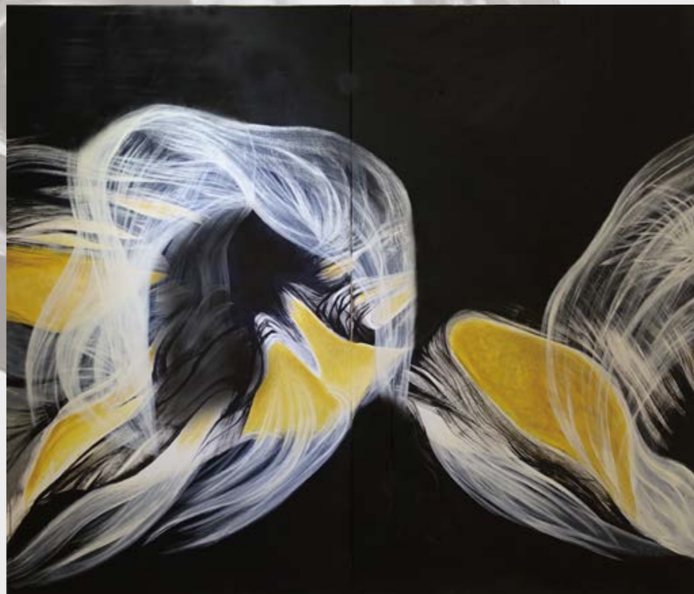
夜遊 194x224cm 壓克力、畫布 2015