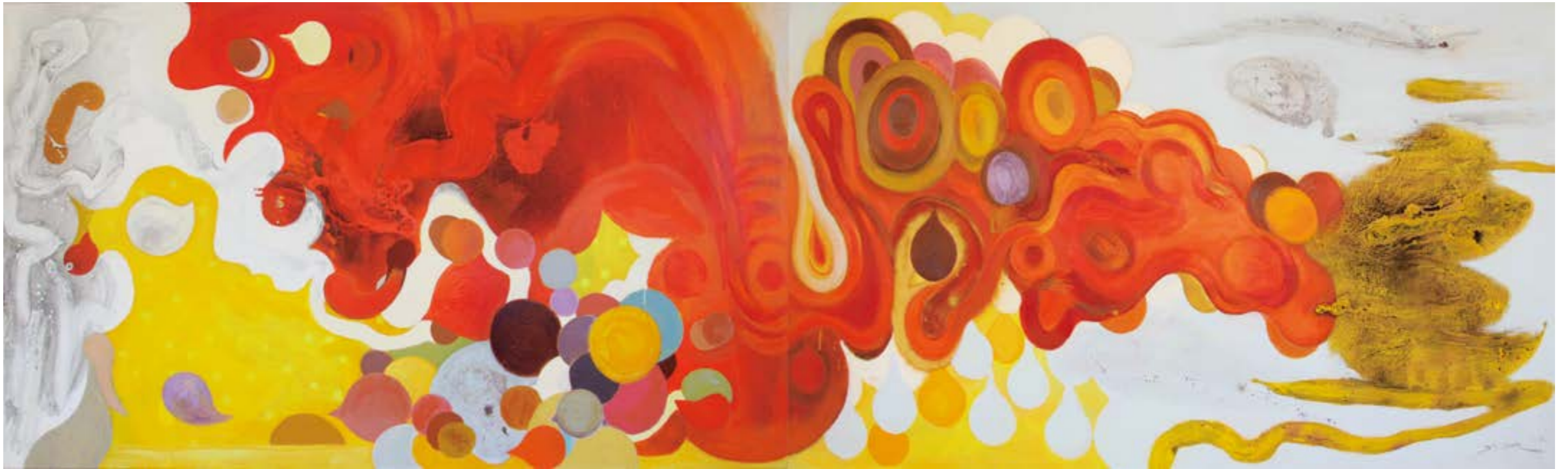
原形-1207 194x130cm(x2) 油畫、壓克力 2012