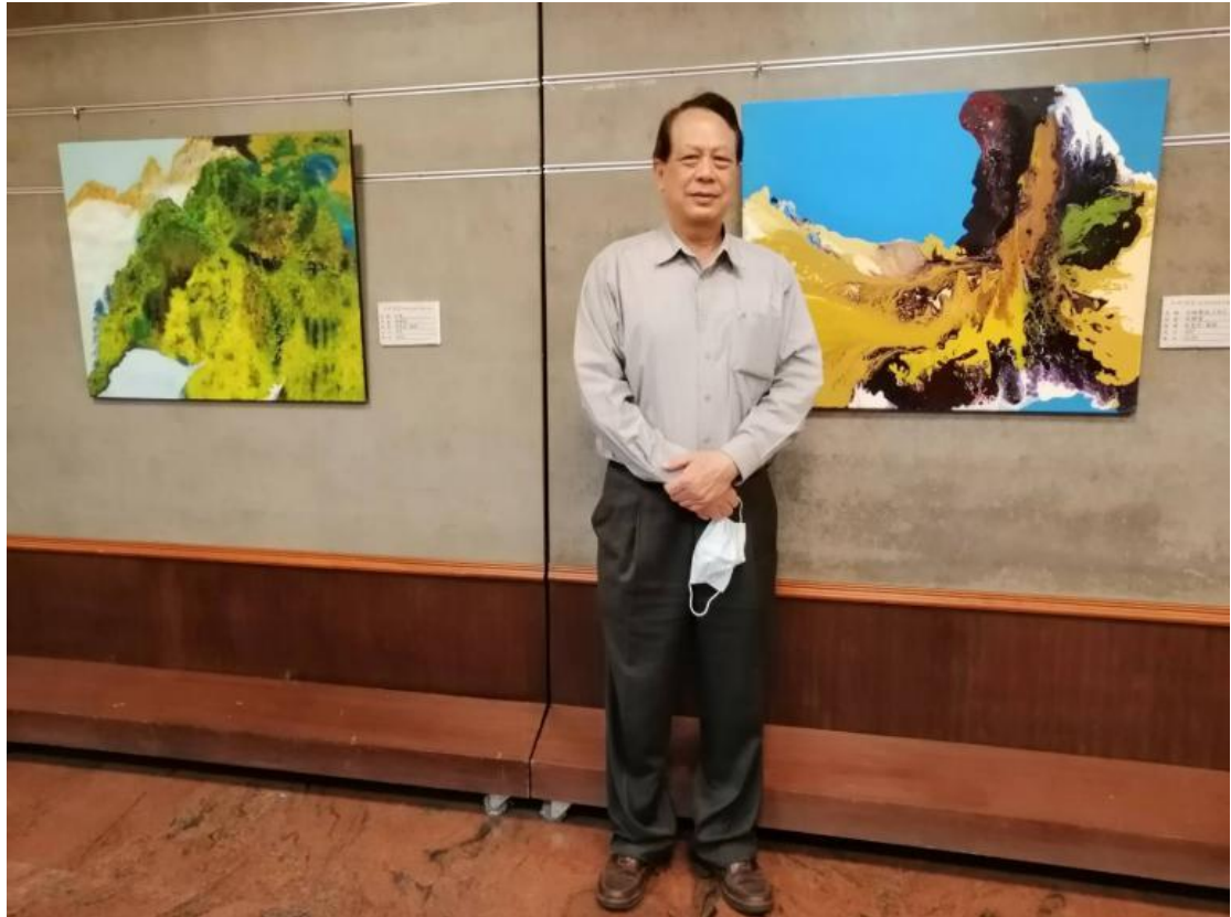
自認畫風介於映象與半抽象之間的林輝堂，多數作品色彩運用大膽活潑。